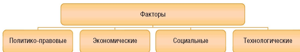
Рисунок 2. Факторы внешней среды, влияющие на функционирование обрабатывающей промышленности г. Вологды

Возможности развития промышленности конкретной территории в отсутствие определённых государством стратегических ориентиров, а также механизма их реализации сильно ограничены.